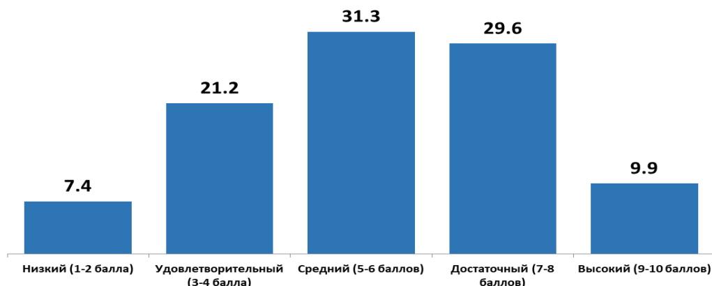
Диаграмма 1 – Распределение учащихся VIII класса по уровням усвоения учебного материала (по результатам РКР), %

С заданием первого уровня успешно справились 89,6% учащихся, 10,4% учащихся допустили ошибки.